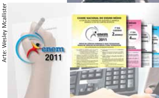
Arte: Wesley Mcallister