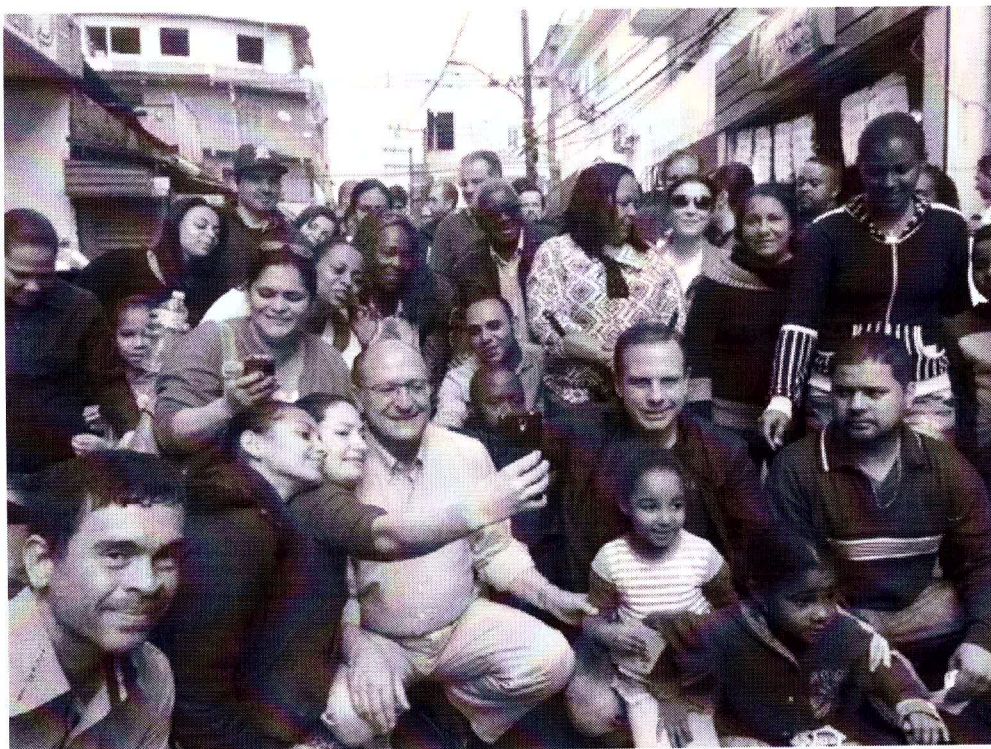
Alckmin e Doria posam para fotos com moradores de Paraisópolis.

Se o uso de viaturas, papéis, servidores da administração pública, em prol de determinada candidatura, pode configurar infração eleitoral, o que se dizer quando o Governador em pessoa se envolve na campanha, emprestando a sua imagem e participando de atos com o inequívoco escopo de projetar seu candidato, dando-lhe visibilidade e prestígio, que o cargo de Governador possui.