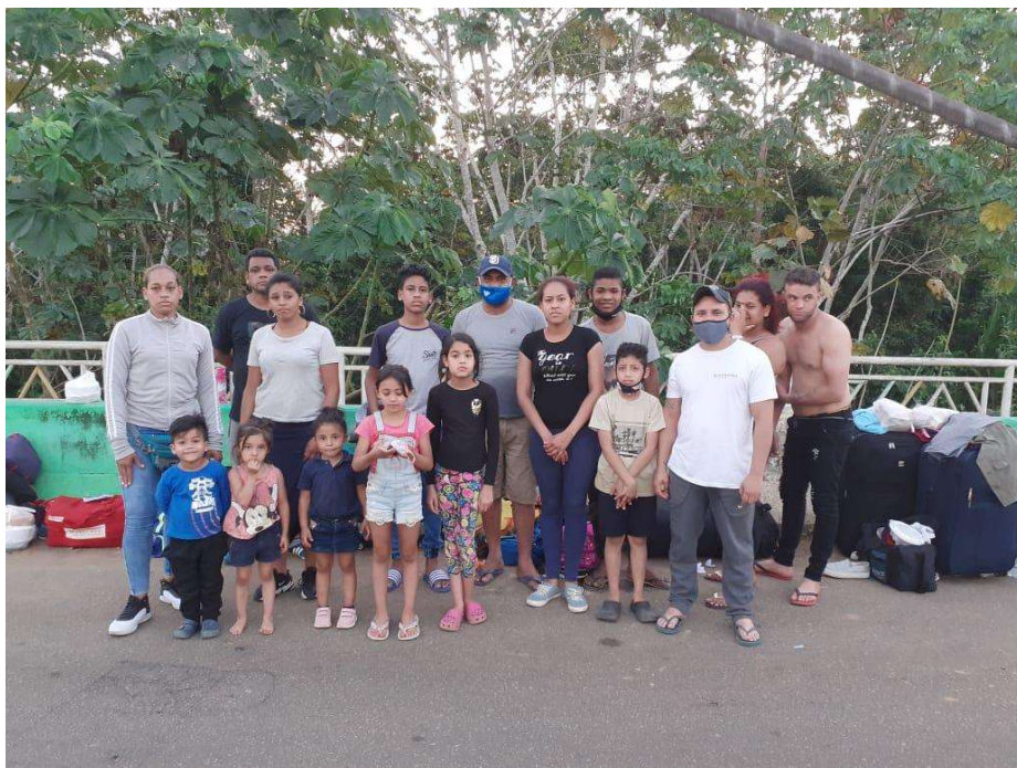
Foto 2: os "18 de Brasília". Retirada em 04/08/2020.

No último dia 10/08/2020, a DPU foi comunicada pela Polícia Federal em Rio Branco/AC que outro grupo havia entrado no Acre sem regularização migratória. Eram duas mulheres, uma com um casal de crianças e outra com seus filhos, nora e neta. 2 mulheres, 6 crianças e adolescentes. Seu destino seria também a imediata deportação, sendo transportados no mesmo dia à ponte de Assis Brasil.