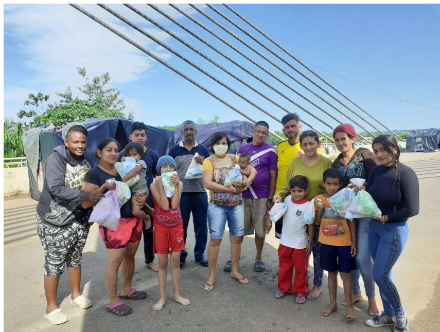
Foto 1: os 14 de Iñapari. Retirada em 26/07/2020.

Já no lado brasileiro da ponte, os efeitos vulnerabilizantes das sanções aplicadas por meio de interpretações do art. 7º da Portaria Interministerial 01/2020 foram sentidos por dois grupos de migrantes que chegaram ao Acre nas últimas semanas. Um primeiro grupo, composto de 18 pessoas, sendo 8 crianças e adolescentes, atravessou o Rio Acre e, após entrevista pela Polícia Federal em Epitaciolândia/AC, foram sumariamente deportados, postos numa van e deixados à própria sorte na Ponte de Assis Brasil, numa “prisão sem grades”: não poderiam nem retornar ao Peru, nem “entrar” no Brasil – a despeito de faticamente nele estarem. Em favor deles, foi movida ação ordinária com pedido de tutela de urgência, distribuída à 3ª Vara Federal da Seção Judiciária do Estado do Acre sob o n. 1004332-48.2020.4.01.3000. Felizmente, o pedido liminar foi deferido (doc. anexo) 8 .