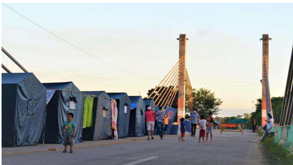
Foto 4: tendas montadas na Ponte de Assis Brasil. Sem data.

Voltando: tem-se presente o interesse público em excepcionar o impedimento de ingresso. Evidentemente, o interesse público, que não se confunde com o interesse de Estado, é forjado pela necessidade de assegurar um tratamento digno e humanitário a esses imigrantes. De igual modo, impedir que os imigrantes permaneçam na situação de absoluta violação de direitos descrita é uma questão humanitária.