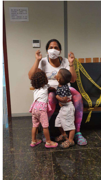
Foto 3: parte do grupo dos "8 de Rio Branco". Foto retirada em 10/08/2020.

Novamente a DPU entrou com ação com pedido de tutela de urgência, que foi deferido pelo douto magistrado Jair Facundes, da 3ª Vara Federal da SJAC, nos seguintes termos (processo n. 1004376-67.2020.4.01.3000, decisão de id 299799388) 9 :