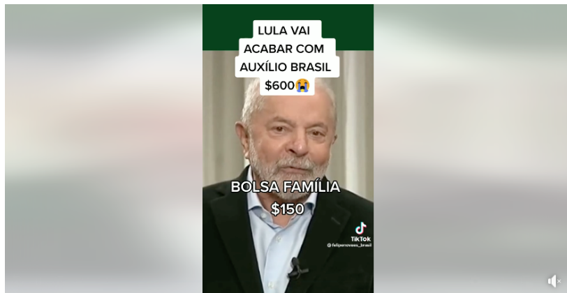
Lula vai acabar com Auxílio Brasil de $ 600 e vai voltar com o Bolsa Família de 80 e 150 reais. Bolsonaro Itaguaí Bolsonaro Mito Paraná Bolsonarianos CEARÁ Bolsona...