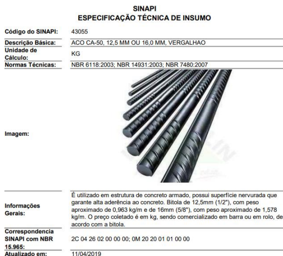
Figura 1 – Exemplo de Ficha Técnica de Insumo com a Classificação da Informação